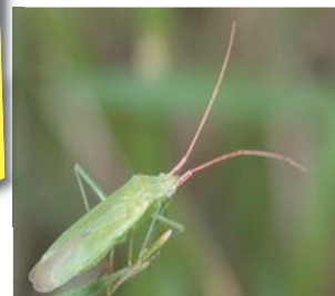
◆アカヒゲホソミドリカスミカメ