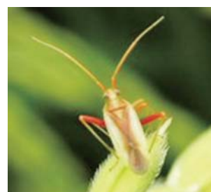
◆アカスジカスミカメ